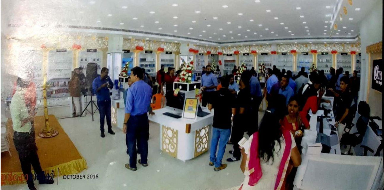
മോണിറ്റർ | OCTOBER 2018

ഉപഭോക്താവിന് ലഭിക്കുന്ന മികച്ച സേവനങ്ങളുടെ പേരിലും വിലപനാനന്തര സർവീസുകളുടെ കരുത്തിലും ജനകീയത നിലനിർത്തിയ സ്ഥാപനം, അനുദിനം പുത്തൻ പരിഷ്കാരങ്ങൾ ഏർപ്പെടുത്തിക്കൊണ്ട് വിപണിയെ സജീവമാക്കി നിലനിർത്തുന്നതിൽ മികച്ച സാധിനം ചെലുത്തിയിട്ടുണ്ട്. ലാപ്ടോപ്പുകളും മറ്റും ഡെമോ മാത്രം കണ്ട് ഉപഭോക്താവിന് തെരഞ്ഞെടുക്കേണ്ടിയിരുന്ന കാലഘട്ടത്തിൽ ആദ്യമായി ലാപ്ടോപ്പുകൾ ഷോറൂമിൽ തുറന്നുവെച്ചുകൊണ്ട് ഉപഭോക്താക്കൾക്ക് തൊട്ടറിഞ്ഞ് വാങ്ങാവുന്ന വിധത്തിൽ സജ്ജമാക്കിയത് ഓക്സിജനാണ്. ഡെമോകളിലും ഫീച്ചറുകൾ അച്ചടിച്ച പേപ്പറുകളിലും മാത്രം വിശകലനം നടത്തി ഉപകരണങ്ങൾ തെരഞ്ഞെടുത്തിരുന്ന കാലഘട്ടത്തിൽ, ഉപയോഗിച്ച് ഇഷ്ടപ്പെട്ട് വാങ്ങാമെന്ന പ്രായോഗികതയെ ഉപഭോക്താക്കൾക്ക് മുന്നിലേക്ക് വെച്ച ഓക്സിജൻ കാലിക പരിഷ്കാരങ്ങളുടെ അമരത്ത് തന്നെയാണെന്ന് തെളിയിക്കുകയായിരുന്നു. കേരളത്തിലെ ടെക് വിപണിക്കൊപ്പം തന്നെ വളർന്നുവന്ന ചരിത്രമാണ് ഓക്സിജന്റേത്. എക്കാലവും സാധാരണക്കാരന് സാധ്യമാകുന്ന വിധത്തിലേക്ക് മികച്ച സേവനങ്ങളെ എത്തിക്കാനാണ് ഓക്സിജൻ ശ്രമിച്ചിട്ടുള്ളത്. ഇന്ന് ഇഎംഐ ഉൾപ്പെടെ നിരവധി സജ്ജീകരണങ്ങളും ഇതിന്റെ ഭാഗമായി അവതരിപ്പിച്ചിട്ടുണ്ട്. വളരെ ലളിതമായ പ്രക്രിയകളിലൂടെ തന്നെ ഇഎംഐ സേവനങ്ങൾ ലഭ്യമാക്കിയിരിക്കുകയാണ്. ലോകോത്തര ബ്രാൻഡുകളുടെ മൊബൈൽ ഫോണുകൾ, ലാപ്ടോപ്പുകൾ, കമ്പ്യൂട്ടർ ആക്സസറീസ്, ഹെഡ്ഫോൺ, ഡെസ്ക് ടോപ്പ്, ലാപ്ടോപ്പ്, സ്മാർട്ട് ഫോൺ, ഹോം അപ്പയൻസ്, കിച്ചൺ അപ്പയൻസ് തുടങ്ങി വിവിധ സേവനങ്ങളെ ഒരു കൂടക്കീഴിൽ അവതരിപ്പിച്ചാണ് സ്ഥാപനത്തിന്റെ